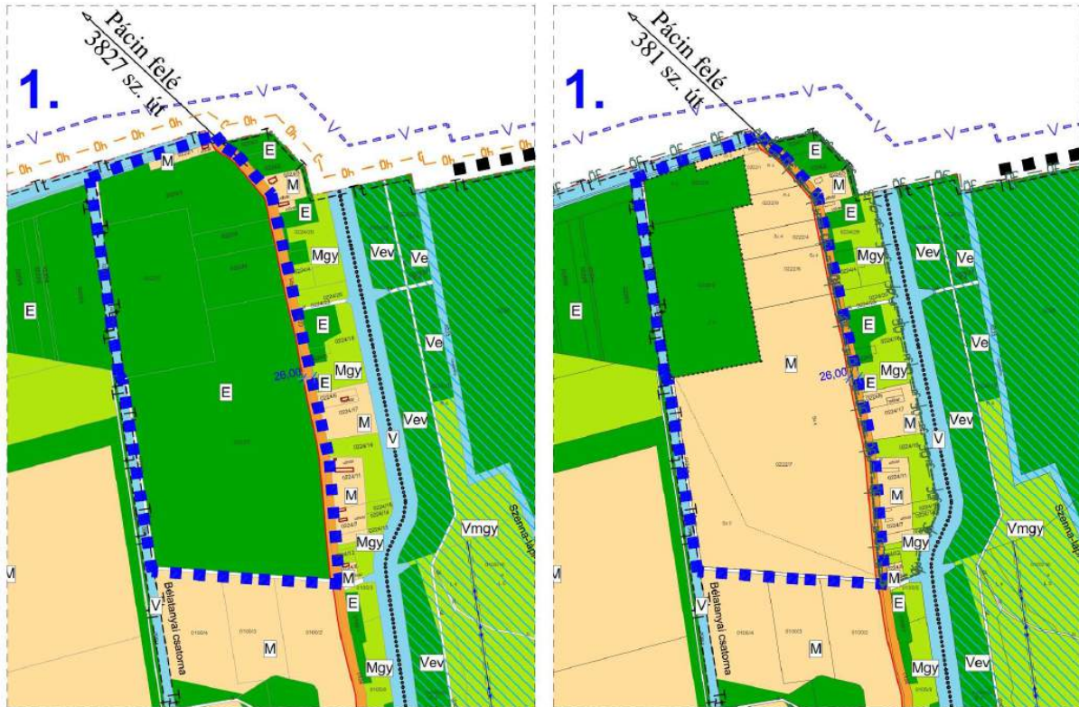
Hatályos terv ! Módosított terv !

Hatályos és tervezett szabályozási tervi kivágat