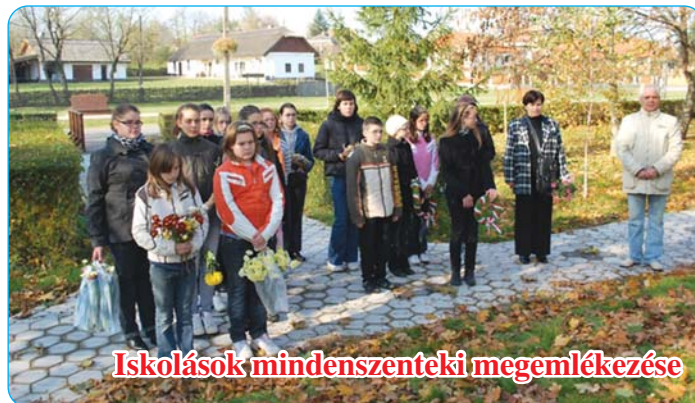
Iskolások mindenszenteki megemlékezése