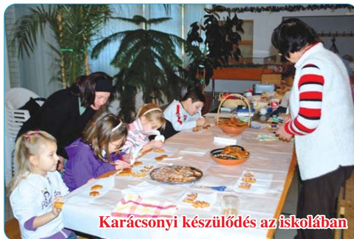
Karácsonyi készülődés az iskolában