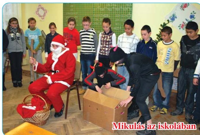
Mikulás az iskolában