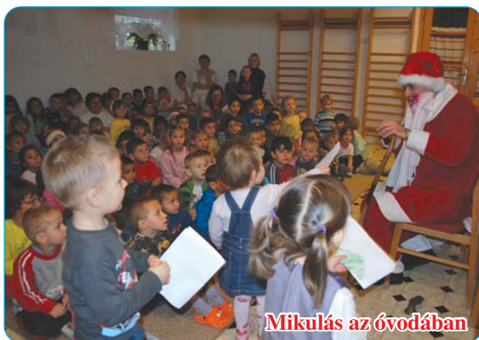
Mikulás az óvodában