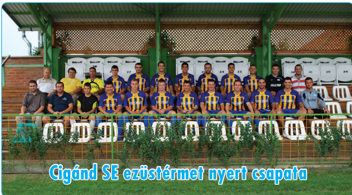
Cigánd SE ezüstérmet nyert csapata

Egyesületünk eddigi legnagyobb sikerét érte el azzal, hogy felnőtt csapatunk június 11. véget ért bajnokságban a 2. helyen végzett. A sikernek számos összetevője volt, amire hosszadalmas lenne kitérni. Úgyhogy a Cigánd Sportegyesület megköszöni minden lelkes játékosának, edzőjének, támogatójának és szurkolóinak az egész éves munkáját és kitartását.