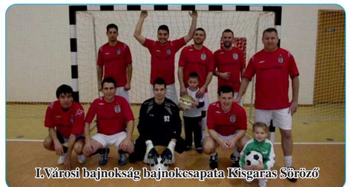
I. Városi bajnokság bajnokesapata Kísgaras Söröző

A foci szeretőik figyelmébe ajánlom, hogy december 22., 26., 29. és január 5., 12 - i napokon indul a II. Cigánd Városi Kispályás Teremlabdarúgó Bajnokság 10 csapat részvételével, ahova a belépés ingyenes! Kezdési időpont: 13.30 - 21.00 óráig.