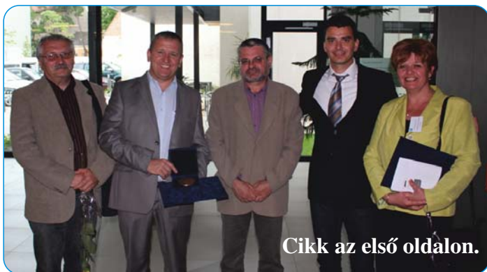
Cikk az első oldalon.

A Cigándi Idősek klubja - Nefejejs kórusa Jelenetek-tánc kategóriában a rendkívül erős mezőnyben a II. helyet érte el.