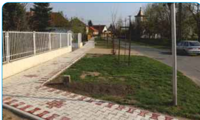
Járda készül és parkosítás az Új Élet utcán.