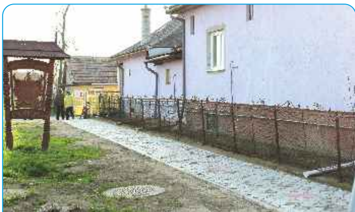
Új járda az Éva presszónál.