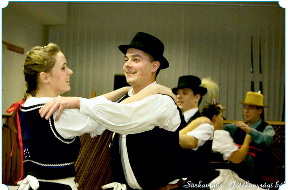
Sarkantyús - Jótékonysági bál