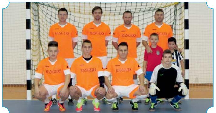
IV. Városi bajnokság győztes csapata

Saját nevelésű játékosaink ott sem vallottak szégyent, sőt a két nap alatt, a szurkolók