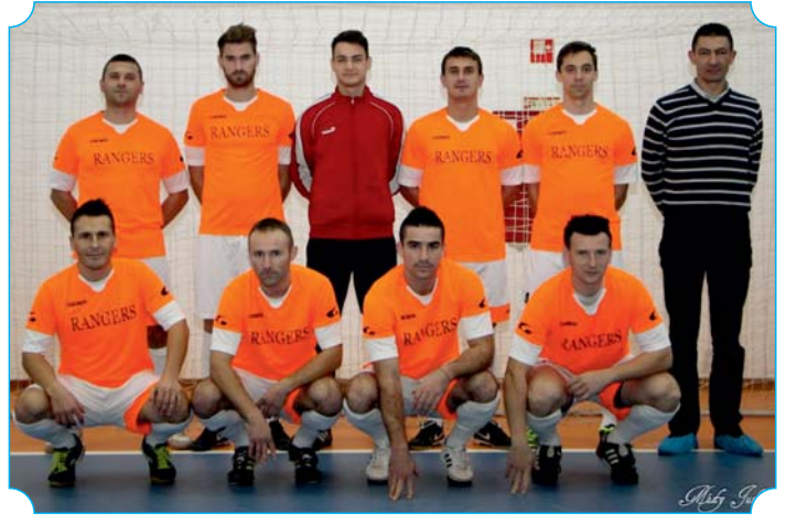
Nyír-Flop – Holding Téli Kupa 3. helyezett csapata: Dream Car