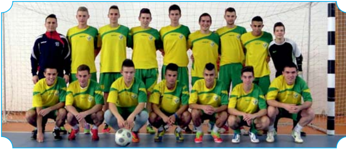
30. Borosi Miskolci döntőbe jutott csapata