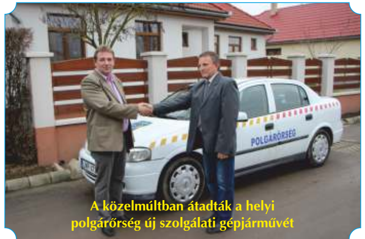
A közelmúltban átadták a helyi polgárőrség új szolgálati gépjárművét

Az útviszonyok is megváltoztak megveszerte. Hajnalra síkossá