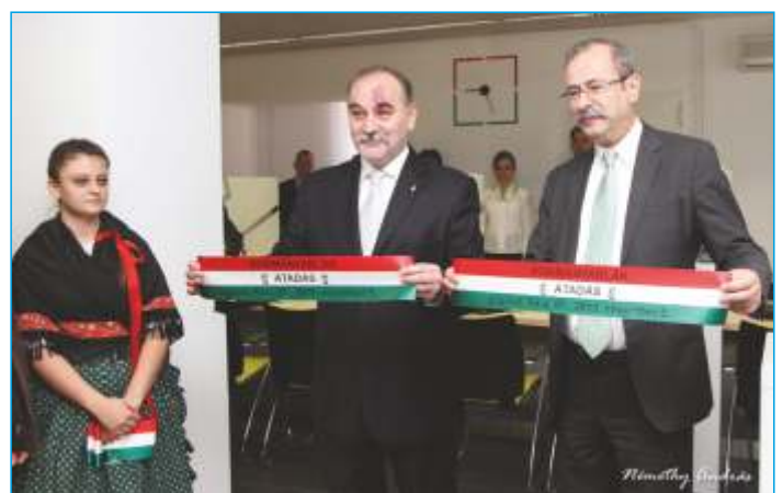
(Borsod-Abaúj-Zemplén Megyei Kormányhivatal Cigándi Járási Hivatala)