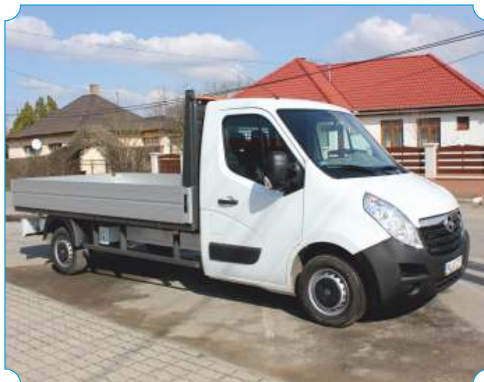
A Cigánd Településüzemeltetési és Városfejlesztő Nonprofit KFT gépparkja új gépjárművel bővült