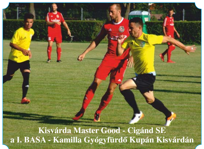
Kisvárd, Master Good - Cigánd SE a I. BASA - Kamilla Gyógyfürdő Kupán Kisvárdán