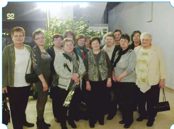
Önkéntesek Nőnap Operett Gálán való részvétele.

- jeles napok: Húsvét, Zöldágjárás-Szent György nap, Pünkösöd, Múzeumok éjszakája. Márton nap