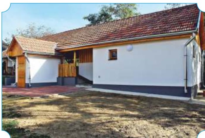
Cigánd épületbővítés II.