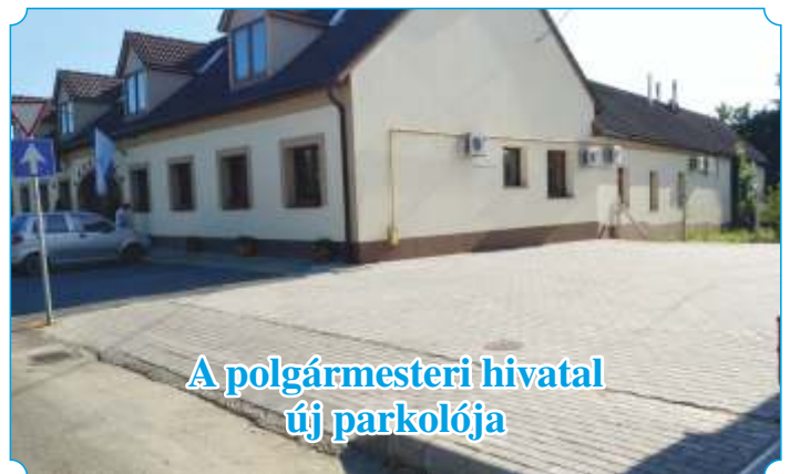
A polgármesteri hivatal új parkolója