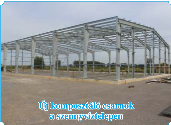
Új komposztáló csarnok a szennyvíztelepen