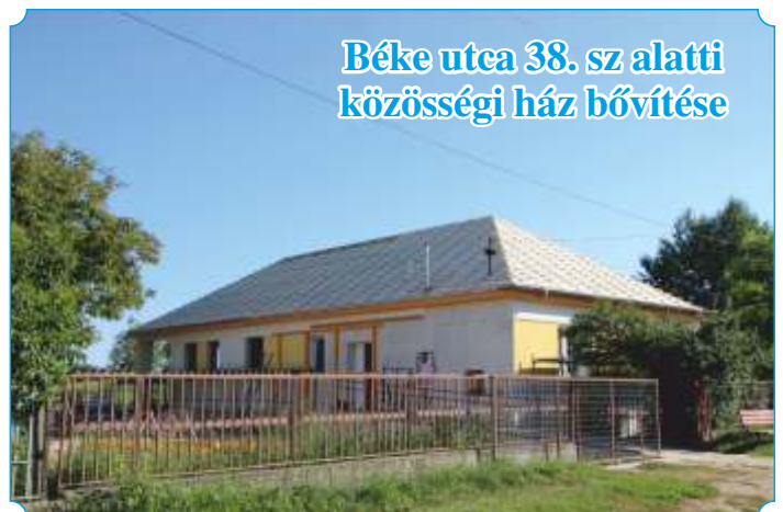
Béke utca 38. sz alatti közösségi ház bővítése