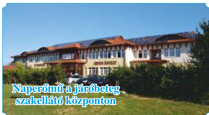
Naperómű a járóbeteg szakellátó központ

Láttuk és a saját bőrünkön éreztük mire számíthatunk, ha baj van. Ki az a településen, aki számára fontosak vagyunk, és érezhettük azt is, hogy kitől kaphatunk segítséget hasonló helyzetekben. Sajnálatos dolog, hogy egy jópáran segíthettek volna, de mégsem tettek. Egyszerűbb volt behúzódnunk és távol tartani magukat a kialakult helyzettől, míg mások értük, miattuk is végezték a feladatukat. Ahogyan ez lenni szokott ilyenkor, a legtöbb segítséget az egyszerű emberektől kaptuk, nem pedig a módosabbaktól - persze tisztelet a kivételnek. Ők képesek voltak a meglévő kicsiből is áldozni a közért. Ez a segítségnyújtás pénzben kifejezhetetlen és óriási köszönet jár érte!