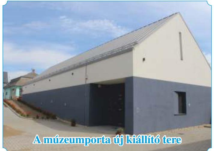
A múzeumporta új kiállító tere