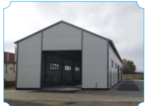
Gazdaságfejlesztés Cigándon - GÉP2020 program - új csarnok