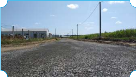
Iparterület-fejlesztés Cigándon - útfejlesztés