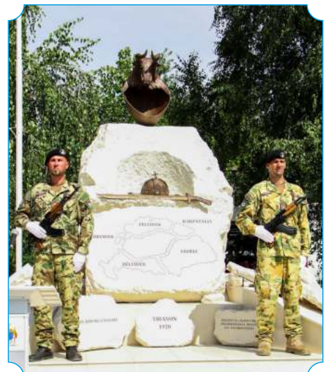
Nemzeti összetartozás emlékműve