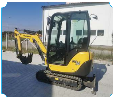
Településüzemeltetés új eszközei