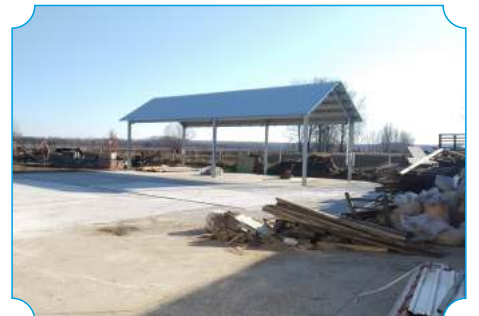
Gazdaságfejlesztés Cigándon - GÉP2020 program - új szín