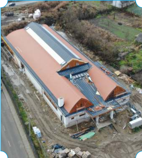
1. Járási tanuszoda építése