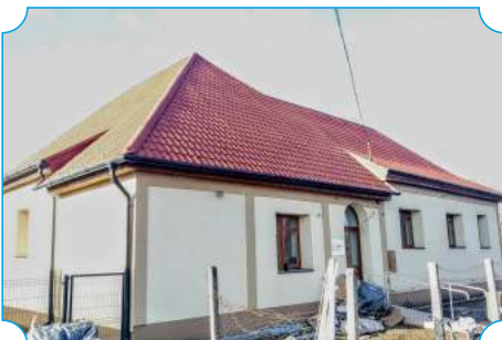
Cigánd szociális városrehabilitációja - II. ütem - fogyatékkal élők nappali otthona