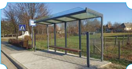
Fenntartható települési közlekedésfejlesztés Cigándon - új utasvárók