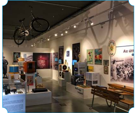
A Bodrogközi Múzeumporta attrakció bővítése - új kiállítás