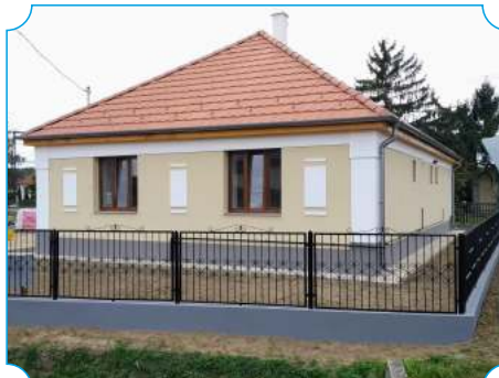
Cigánd Város szociális alapszolgáltatásainak infrastrukturális fejlesztése - Fő utca 166. szociális bérlakás