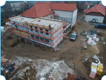
Központi iskola bővítése